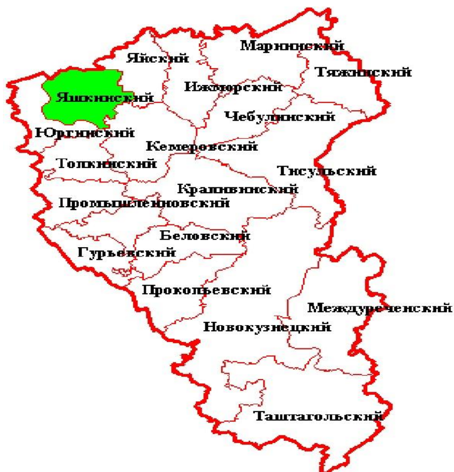
Рисунок 1 – карта Кемеровской области

Яшкинский округ расположен в северо-западной части Кемеровской области. На Востоке территория граничит с Яйским районом, на Юге – с Кемеровским и Топкинским районами, на Западе – с Юргинским районом, на Севере примыкает к Томской области. Центром Яшкинского района является поселок городского типа Яшкино, расположенный в 86 км от областного центра. Общая площадь района – 3.5 тыс. кв. км (3.6 % площади Кемеровской области), из них 0.7 тыс. кв. км (31.3 %) – сельскохозяйственные угодья.